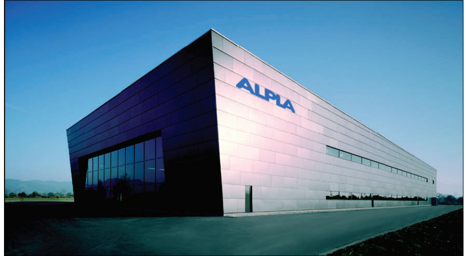
Alpla Werk in Fußach, Österreich, Alwin Lehner GmbH & Co KG